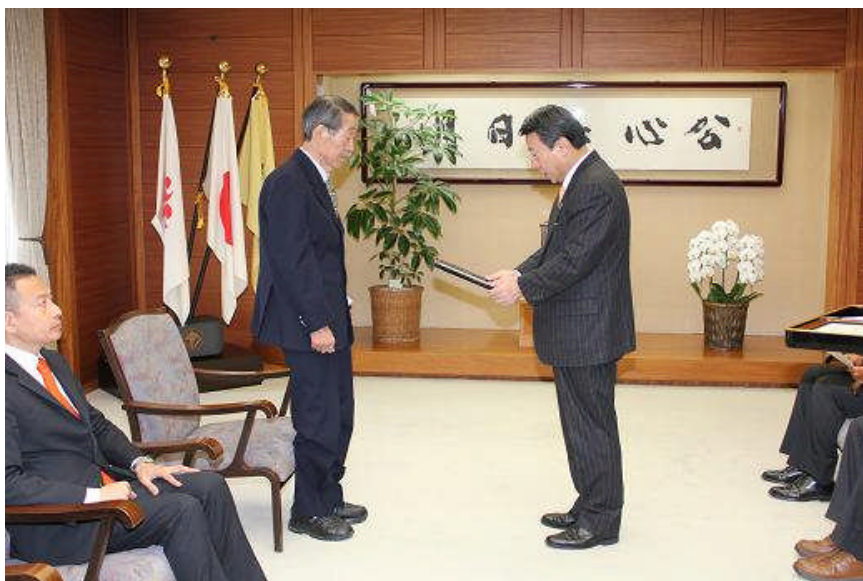
表彰式 右側が川口市長 左は エキスパート・オブ・ジャパン社長

三月八日発行の日刊工業新聞に奨励金交付の記事が掲載されました。 転載して紹介します