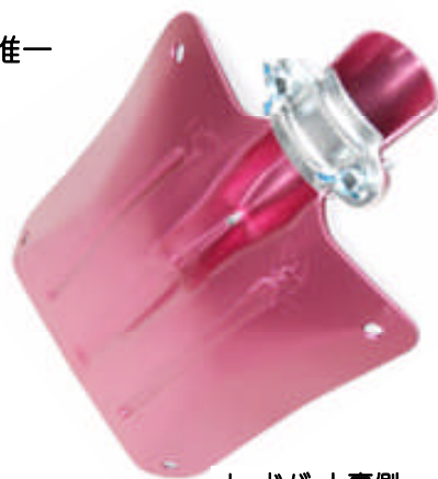
レッドバット裏側