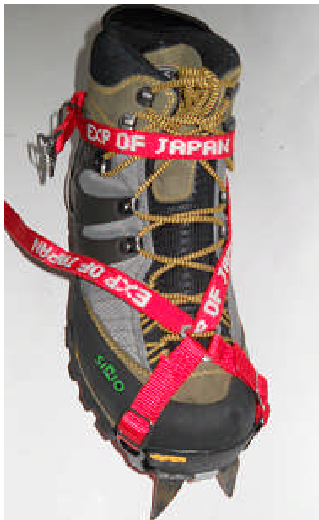
クロモリ8P㈬ フリクション装着例

帰社後、クロモリ8P㈬、10P㈬、12P㈬、14P㈬を買ったばかりの靴に装着してみると、どのアイゼンにもジャストフィットします。本誌前月号、フリクション装着法の項でプチドラゴン装着例を紹介しましたが、今月はクロモリ8P㈬に装着したシリオ。P.F.46のフリクション装着法を改めて写真で紹介します。要は丸カン、三角カン、三股カン、ワイヤーの外側からベルトを通すと楽に装着できることです。