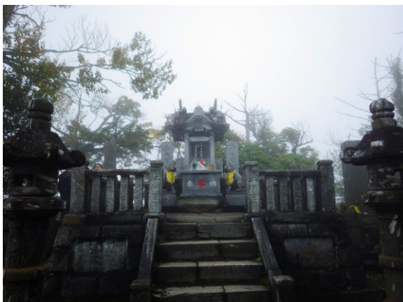
(奥宮 妙法ヶ岳山頂)

三峯山博物館は学術的に貴重な二ホンオオカミの毛皮 2 点を収蔵する博物館として注目されている。入館料大人 300 円。貴重な資料なのでお時間ある方は入館をお勧め。