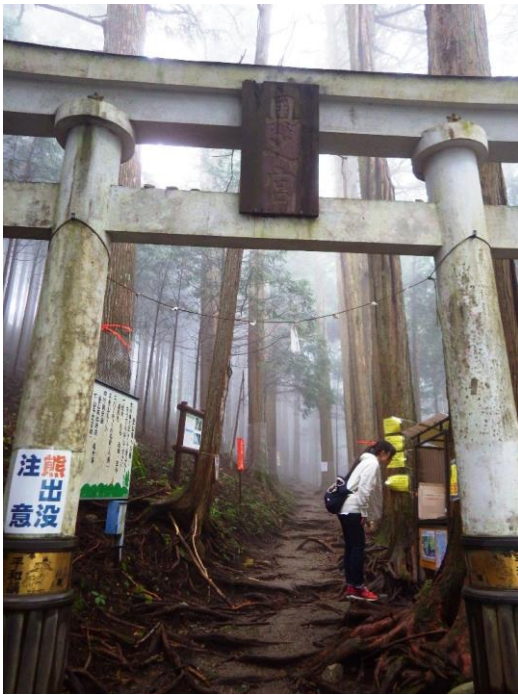
(奥宮参道入口から最初の鳥居)

13時10分 奥宮がある妙法ヶ岳に向かい出発 奥宮参道入口から舗装された道を歩いて数分、鳥居が現れる。霧が立ち込め異様な雰囲気醸し出している。 登山届のポストも設置されている。 そして「熊出没注意」の表示もある。 今回はクマ鈴を持参してないので、姉と大きな声で話しながら歩くことにする。 一礼して鳥居をくぐる。鳥居をくぐると、山道となる。