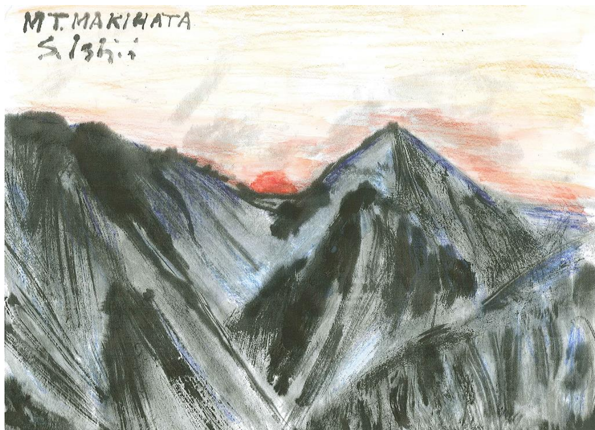
巻機山 画:石井貞男