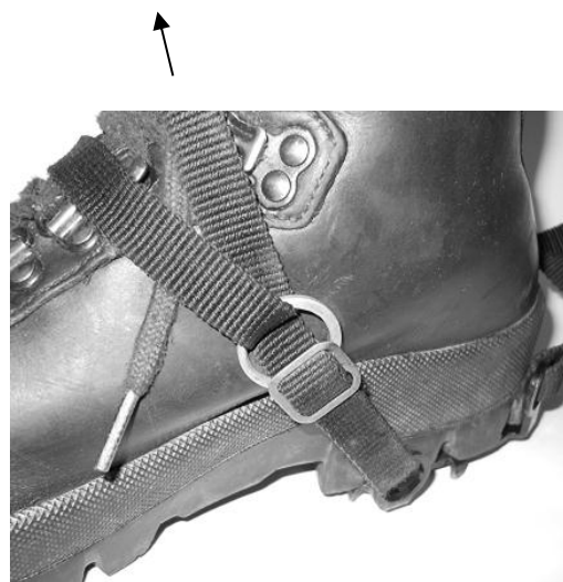
プチドラゴン装着例

プチドラゴンなどもフリクション装着法は有効です。トラブルは生じません。我社の商品のみならず、他社製品にも効果が十分あります。 (カタログ 4 頁参照)