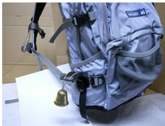
エキスパート型ベルと鈴掛