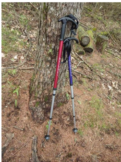
4 段クッション金剛