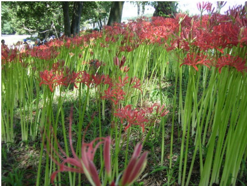
巾着田の曼珠沙華