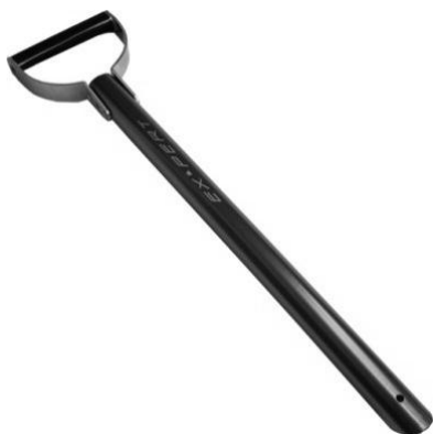
多目的 レッドバット用シャフト (SN12) ジュラルミン製 カラー:ブルー 長さ:54 cm 重量:275g シャフト上部の 6 mmローブを通す 穴はスノーハーケン用。 税込価格:¥5,250