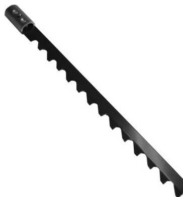
氷も切れる レッドバット用スノーソー (SN13) 特殊鋼 (SK-5) 製 カラー:ブラウン(赤色焼付塗装) サイズ:405 mm×25 mm 重量:115g レッドバット用シャフトに収納でき、シャフトが柄にもなるラチェットつき。氷・雪用鋸。 税込価格:¥4,830