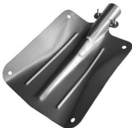
機能美追求 レッドバット (SN11) ジュラルミン製 カラー:ピンク サイズ:222 mm×258 mm 重量:365g 税込価格:¥5,460