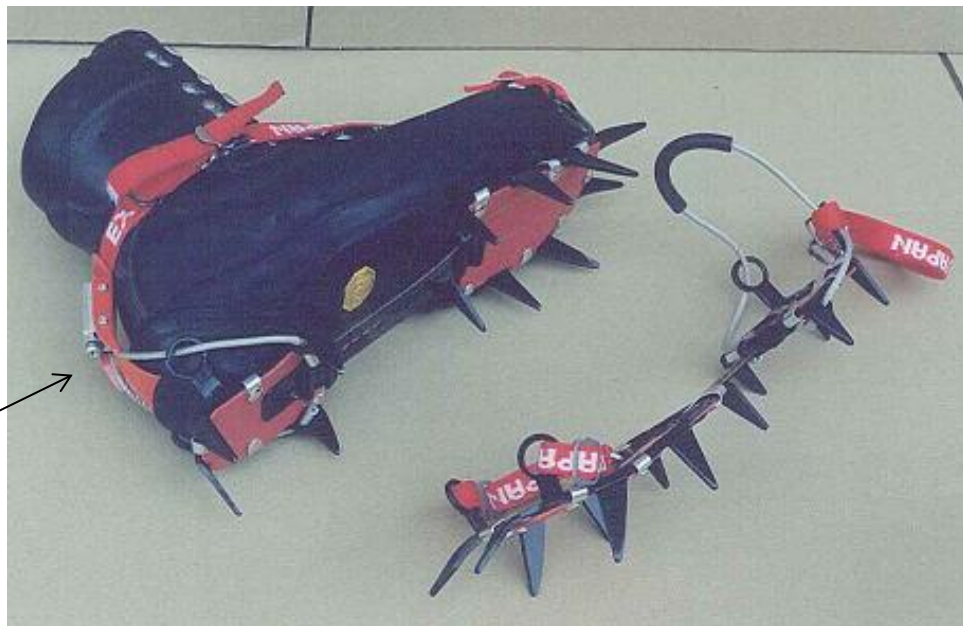
ワイヤー長さ 調整ネジ